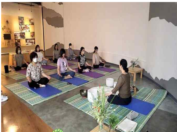
싱잉볼 체험사진 예시