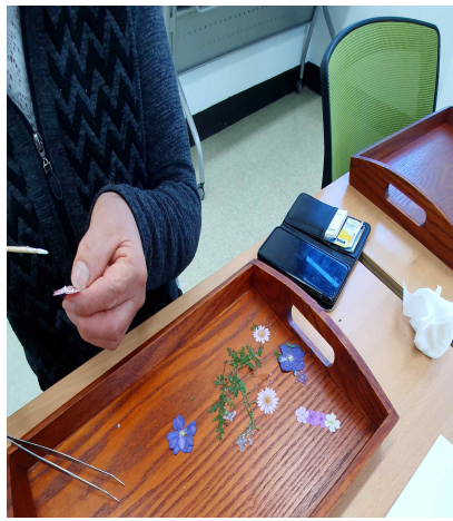
압화 원목트레이(수강생 작품)